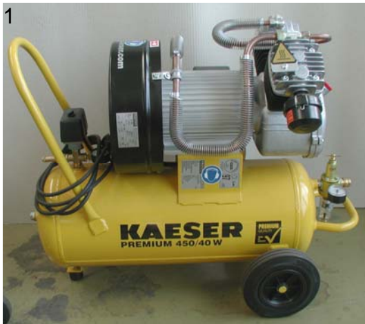
2-Zylinder-Kolbenkompressor Artikelnummer 89001 0000

Optionales Zubehör: Nebelöler mit Schnellsteckanschluss (Abb.2)