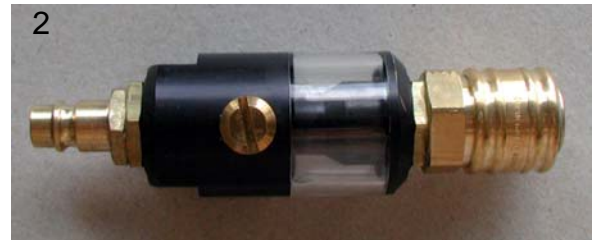
Nebelöler, Artikelnummer 98000 1500