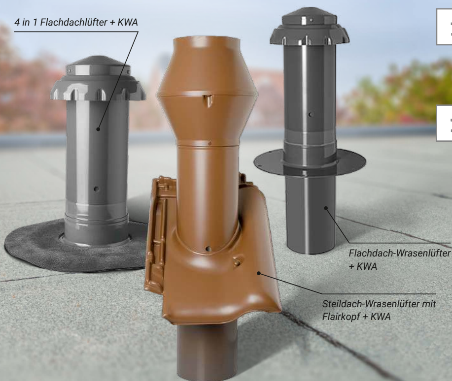
Flachdach-Wrasenlüfter + KWA